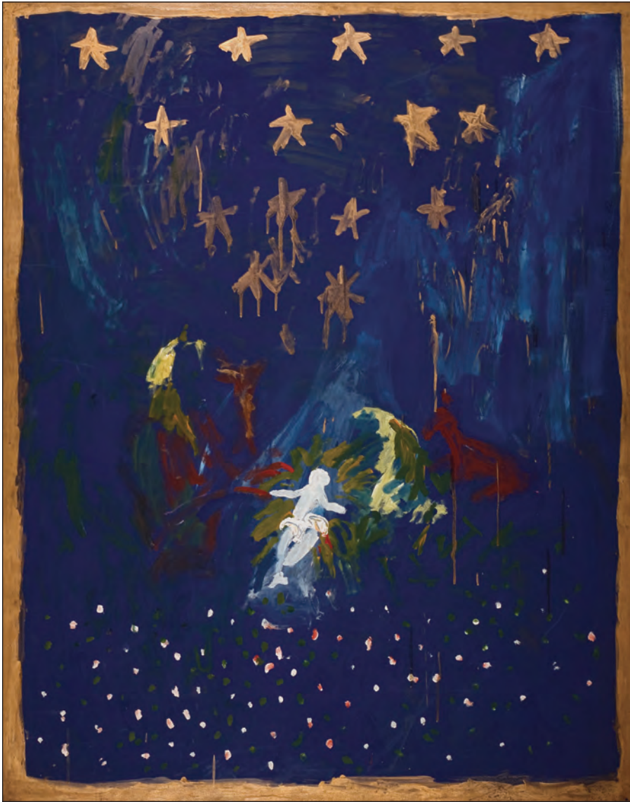
Retablo, 1982. Diana Aisenberg