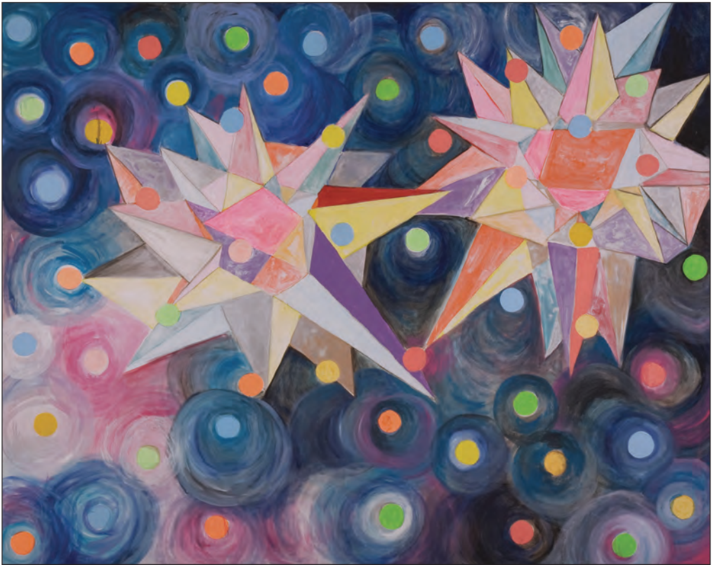
Noche estrellada, 2008. Diana Aisenberg