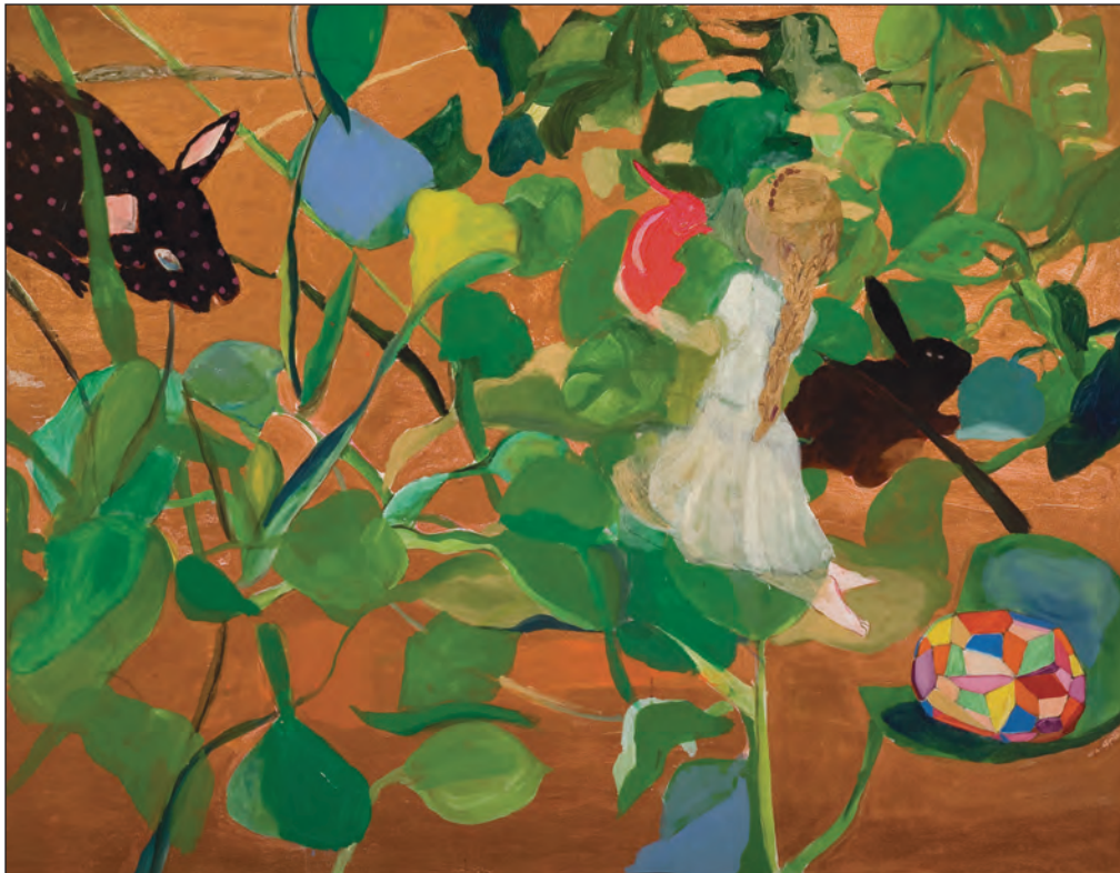
Primer cielo con nutria loca, 2006. Diana Aisenberg