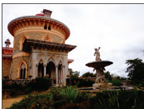
Fig. 10. Palácio de Monserrate . 1863.