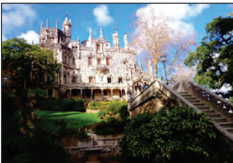
Fig. 3. Quinta da Regaleira . 1898–1912.