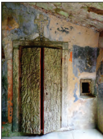
Fig. 8. Convento dos Capuchos . 1560.