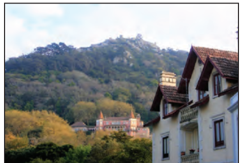
Fig. 4. Casa dos Penedos . 1922.