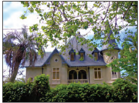
Fig. 2. Chalet Biester . 1890.