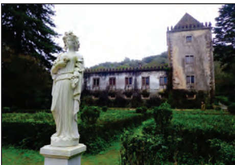
Fig. 5. Quinta da Ribafria . 1541.