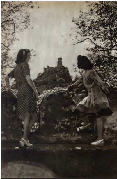
Fig. 1. Castelo da Pena . 1944.