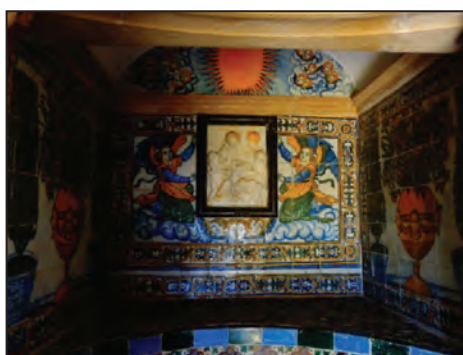
Fig. 12. Quinta da Penha Verde . 1534-.