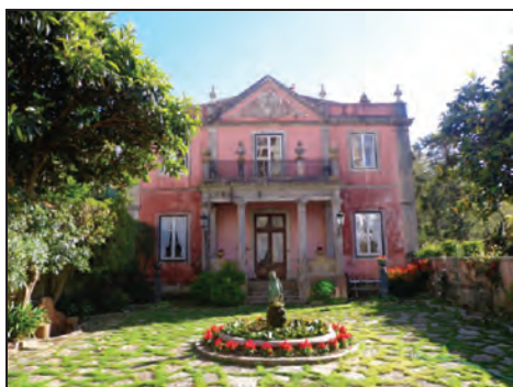
Fig. 9. Quinta da Princesa . S. XIX.