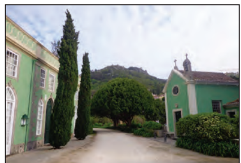
Fig. 6. Quinta de São Sebastião . 1780.