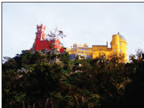
Fig. 7. Castelo da Pena . 1836.